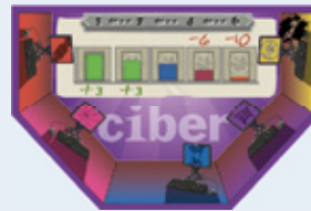
6 Strategische Projecten