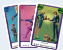
30 Senior Consultants