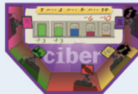
12 Internationale Projecten